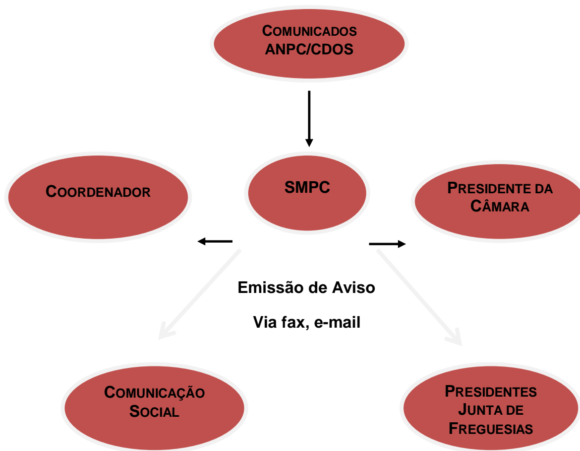
Figura 5 - Sistema de monitorização, Alerta e Aviso

A barragem do Pisco está classificada com classe II e a do Penedo Redondo está em processo de classificação, ficando assim livres da obrigatoriedade da existência do sistema de alerta e aviso.